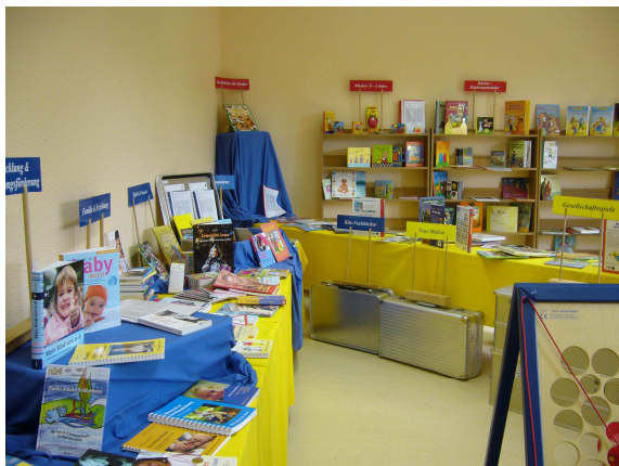
Bücher für große und